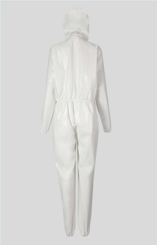
Fato integral impermeável descartável